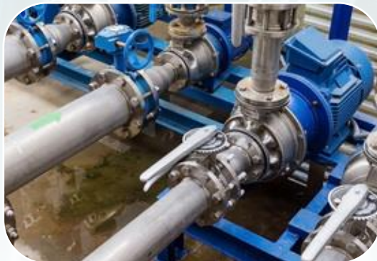
Водоснабжение и водоотведение