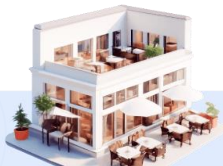
Кафе, рестораны и салоны красоты