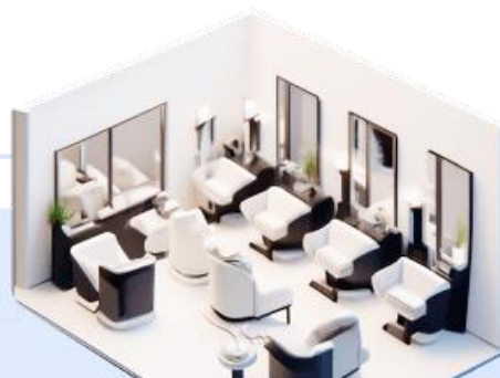
Нежилые помещения и другие объекты