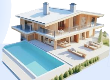
Частные дома и коттеджи