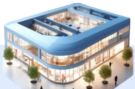
Торговые центры и отдельно стоящие здания