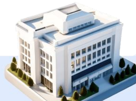
Банки и административные здания