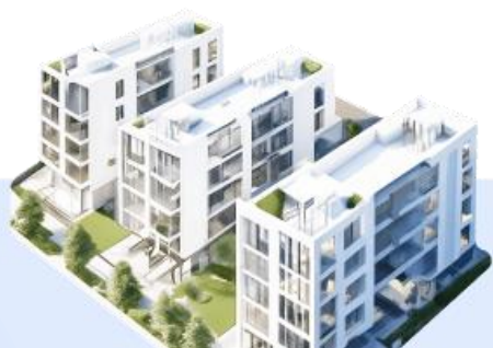
Жилые квартиры и апартаменты