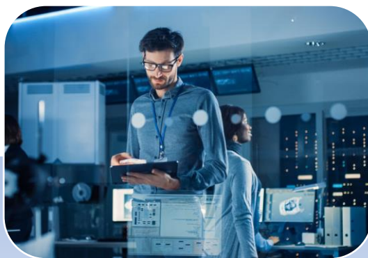
Технические и проектные изыскания для оптимизации тех условий